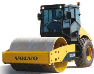
Дорожные катки (уплотнители)

Наконец, нам видится, что группа NTN-SNR имеет большое будущее. Для нас это имя означает широкий выбор продукции и значительный вес на мировом рынке».