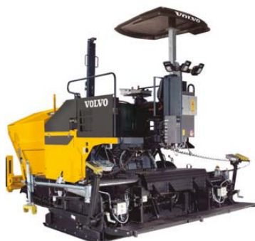
Отделочные дорожные машины (дорожные бетономешалки)

ОБЪЕКТ ХАМЕЛЬН: Руководитель: г-н Удо Хойкродт Производственная площадь: 90 000 м 2 Количество работников: 490 человек