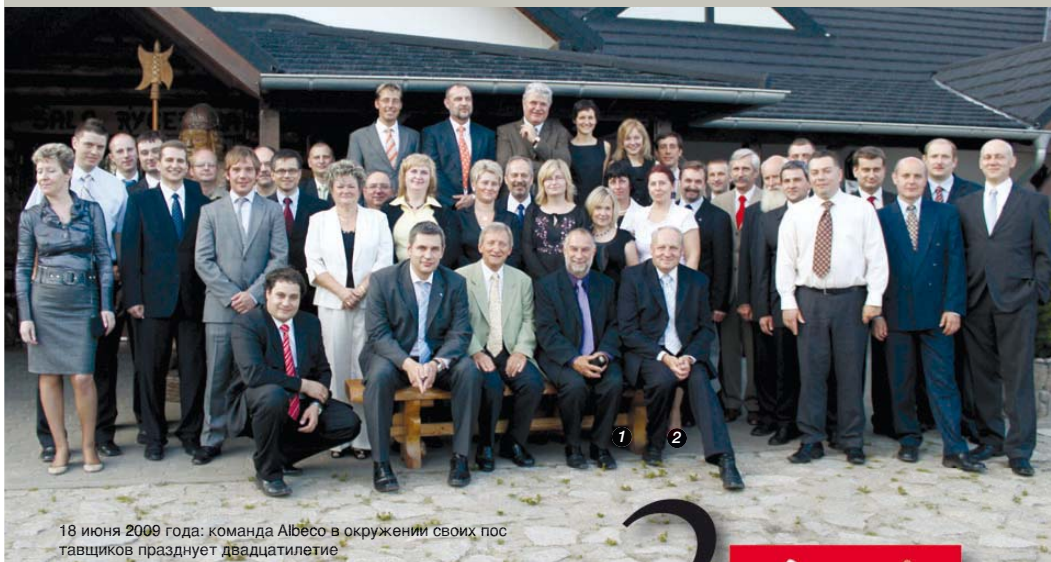
18 июня 2009 года: команда Albeco в окружении своих поставщиков празднует двадцатилетие

770 м 2 центрального офиса, открытого в Плевиске, планируется оборудовать территорию площадью 12 000 м 2 под офисные и складские помещения